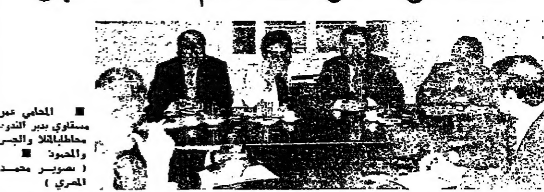
طرابلس - من كمال حيدر